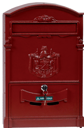
ROSSO D-2152/R * 804145