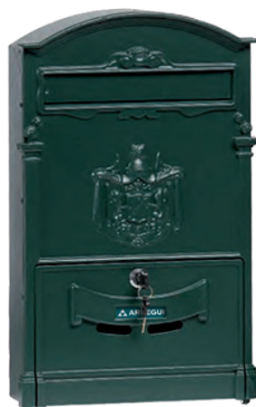
VERDE SCURO D-2152/V * 804152