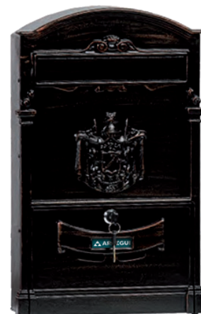
BRONZO D-2152/B * 804169