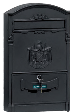
NERO D-2152/N * 804176