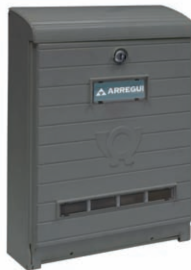
GRIGIO E1065 * 734841