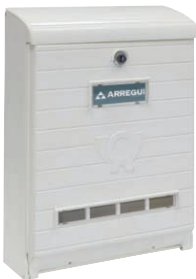
BIANCO E1061 * 734834