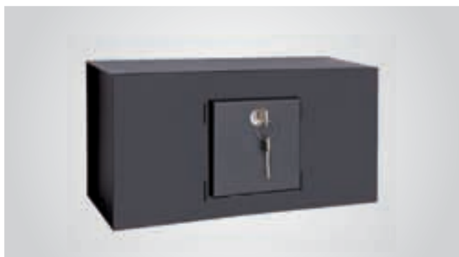
Sistema di apertura tramite chiave punzonata.