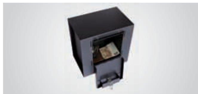
Può contenere piccoli oggetti di valore.