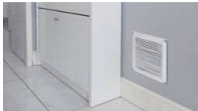
Può essere nascosta in qualsiasi angolo della vostra casa o proprietà.