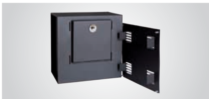
Con la rimozione della griglia di aerazione è possibile accedere alla serratura della cassaforte.