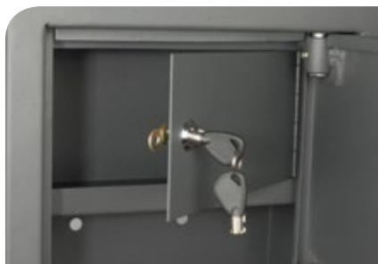
Tesoretto e Cassetto porta oggetti.