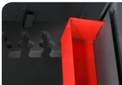
Rastrelliera in gomma per fucili.

! • Rastrelliera in gomma • Tesoretto con serratura a chiave (ref. ARM050335, ARM070335, ARM100335)