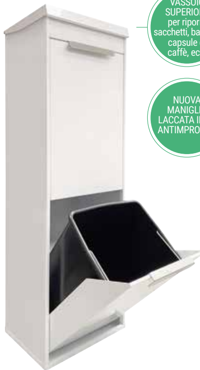
ECOCLAS PLUS CR221-E