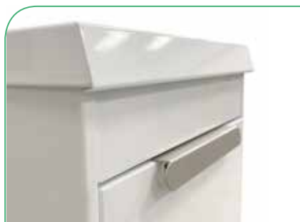
Maniglia con finitura laccata inox antimpronta.