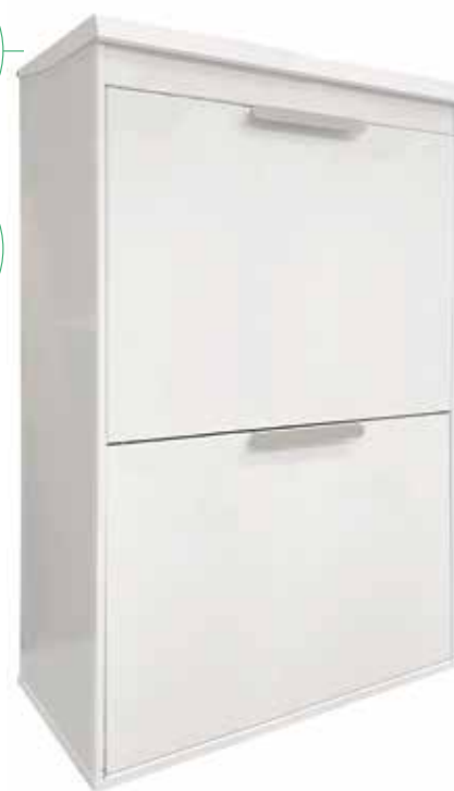
ECOCLAS PLUS CR621-E

VASSOIO SUPERIORE per riporre sacchetti, batterie, capsule di caffè, ecc.