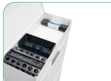
Vassoio superiore per riporre pile, capsule da caffè, ecc.