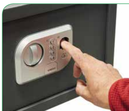
Lettore di impronte digitali